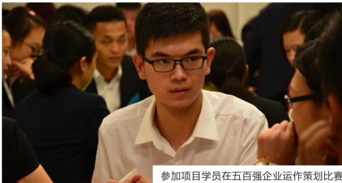
参加项目学员在五百强企业运作策划比赛

在一周内，每个团队在公司期间要参与以团队为单位的环球基金投资大赛。团队需要模拟管理个人、企业财富，在给定市场信息下以团队运作自己的基金。包括：环球经济数据发福，投资战略分析，决策制定，基金运作等环节。团队顾问和公司导师都会对参赛团队进行一定的指导。