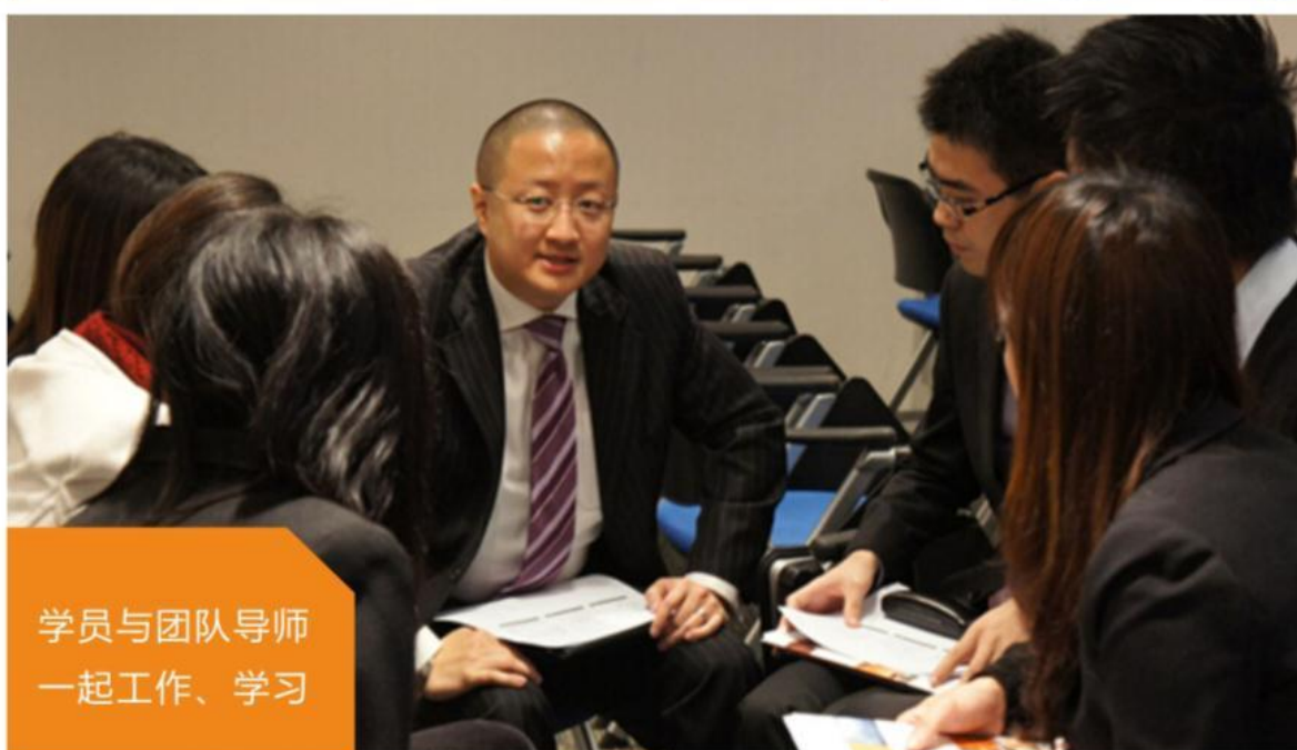
学员与团队导师 一起工作、学习