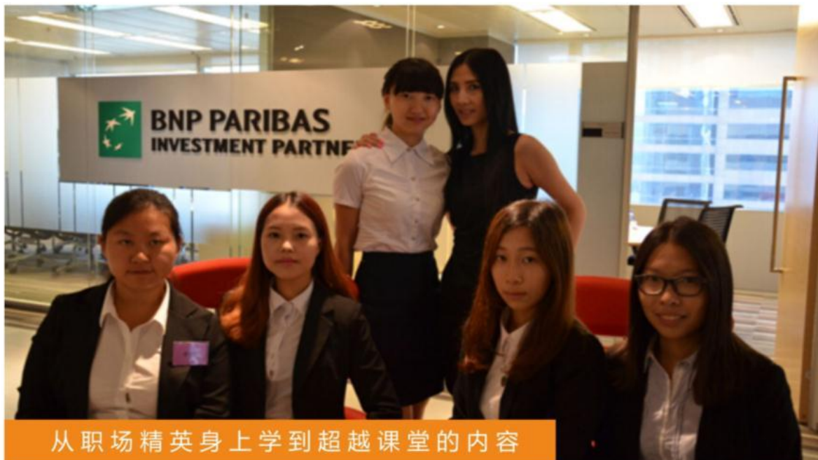
从职场精英身上学到超越课堂的内容